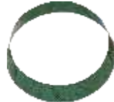
YK 100 - 2