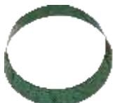
YK 100 - 1