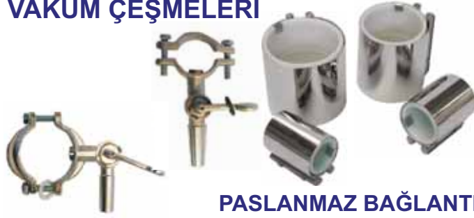
PASLANMAZ BAĞLANTI PARÇASI