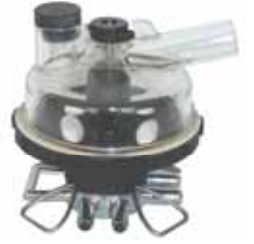
350 ccm Harmoni